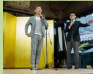
ヒガシ逢ウサカ(漫才)