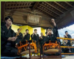
大津祭源氏山囃子保存会(郷土芸能)