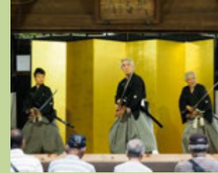
桔梗館みやび支部(剣舞・詩舞)