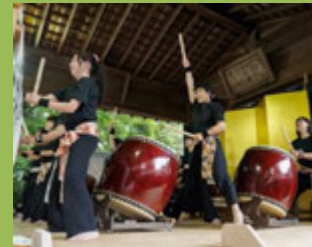
和太鼓集団 湖鼓RO(和太鼓)