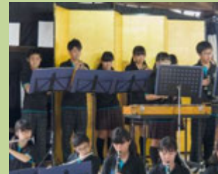
打出中学校吹奏楽部(吹奏楽)