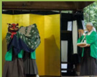
かみの一座(獅子舞)