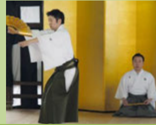
大津祭郭巨山保存会(郷土芸能)